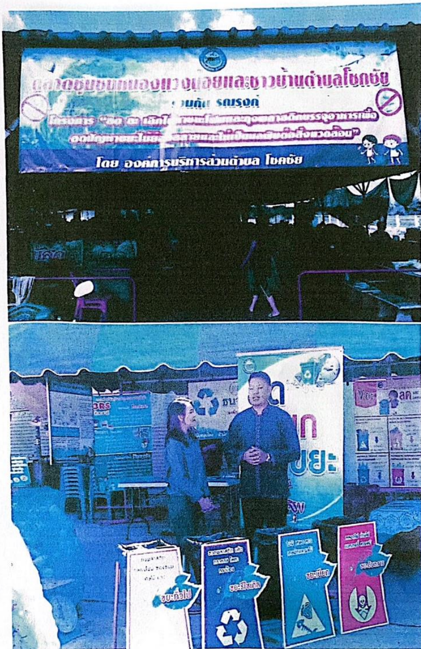
กิจกรรม รณรงค์ส่งเสริมสร้างสุขลักษณะและรักษาความสะอาดในตลาดชุมชนบ้านหนองวางน้อย