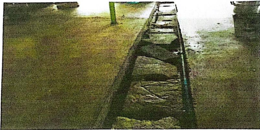
วางระบายน้ำเสียชนิดรางปิด