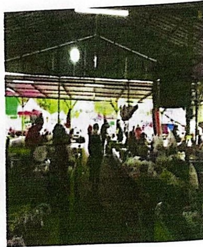
อาหารวางสูงจากพื้น ไม่น้อยกว่า 60 ซม.