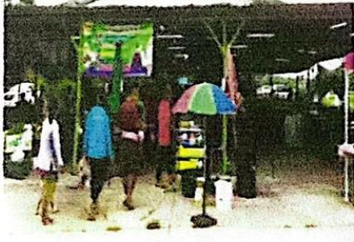
โครงสร้างและหลังคาตลาด