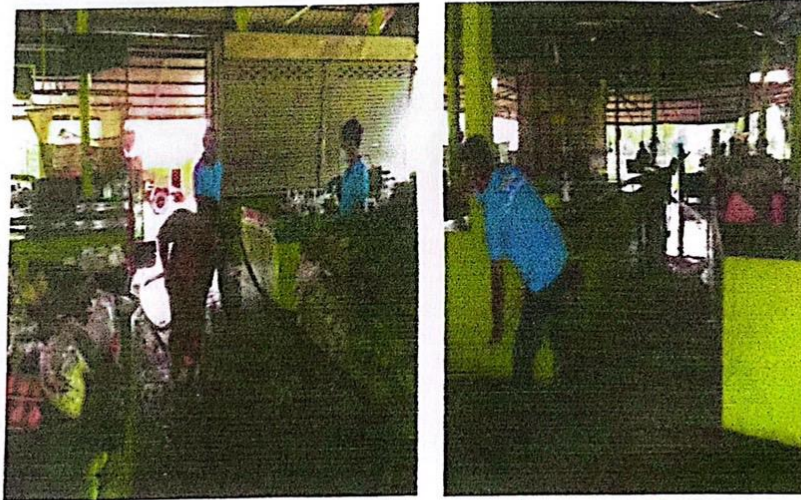
ล้างตลาดสัปดาห์ละ 1 ครั้ง