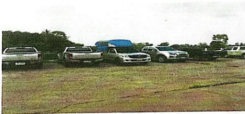
ที่จอดรถสาธารณะ