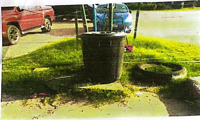
ที่รองรับมูลฝอย