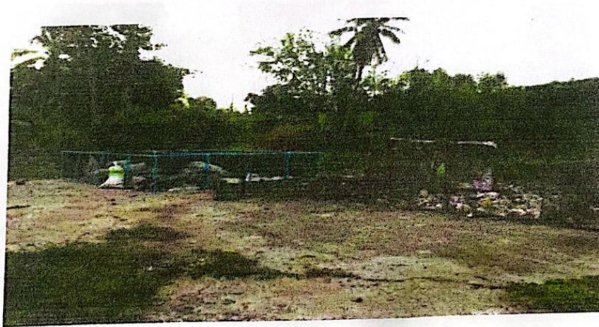
การกีดแยกขยะ