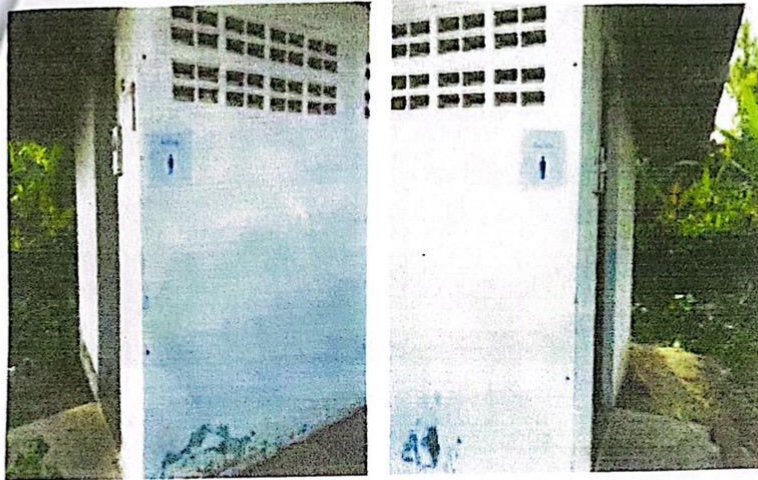
แยกห้องส้วมชาย-หญิง