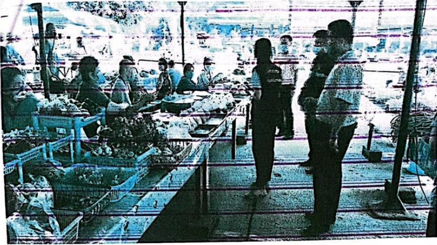
ผู้ค้าและผู้ประกอบอาหารแผงกาศสะอาดเรียบร้อย